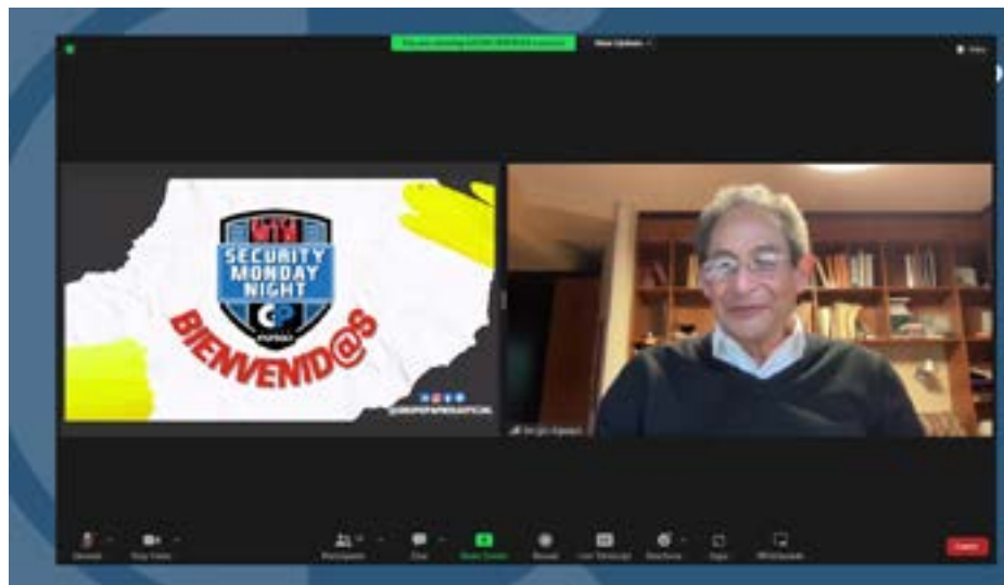
Sergio Aguayo Quezada, académico, analista y politólogo

Aguayo comentó que México se consolida como el primer lugar en la categoría de los países más peligrosos para ejercer el periodismo. En los últimos cinco años, el país ha registrado un promedio entre 8 y 10 periodistas asesinados cada año. Estas cifras, de acuerdo con el estudio "Reporters without borders – 2020 Balance: murdered journalists", (p.6).