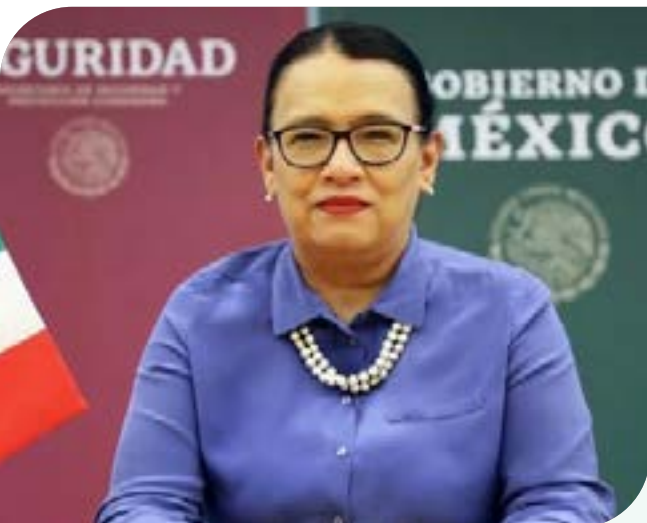
Lic. Rosa Icela Rodríguez, titular de la Secretaría de Seguridad y Protección Ciudadana