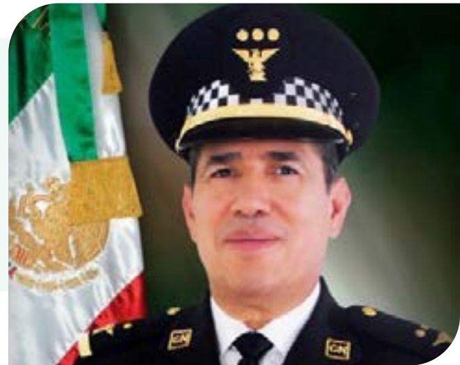
General Luis Rodríguez Bucio, Comandante de la Guardia Nacional